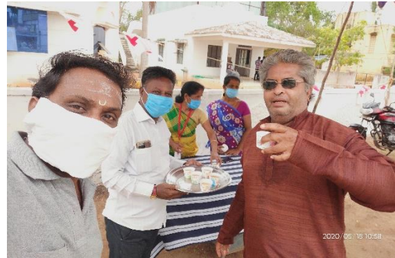
With Thanjavur Youth Red Cross – President